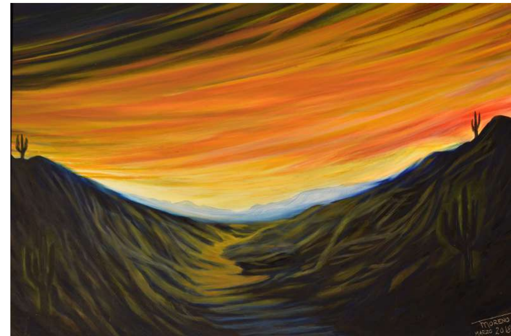
Title: Chilcahuada Medium: Oleo/Oil