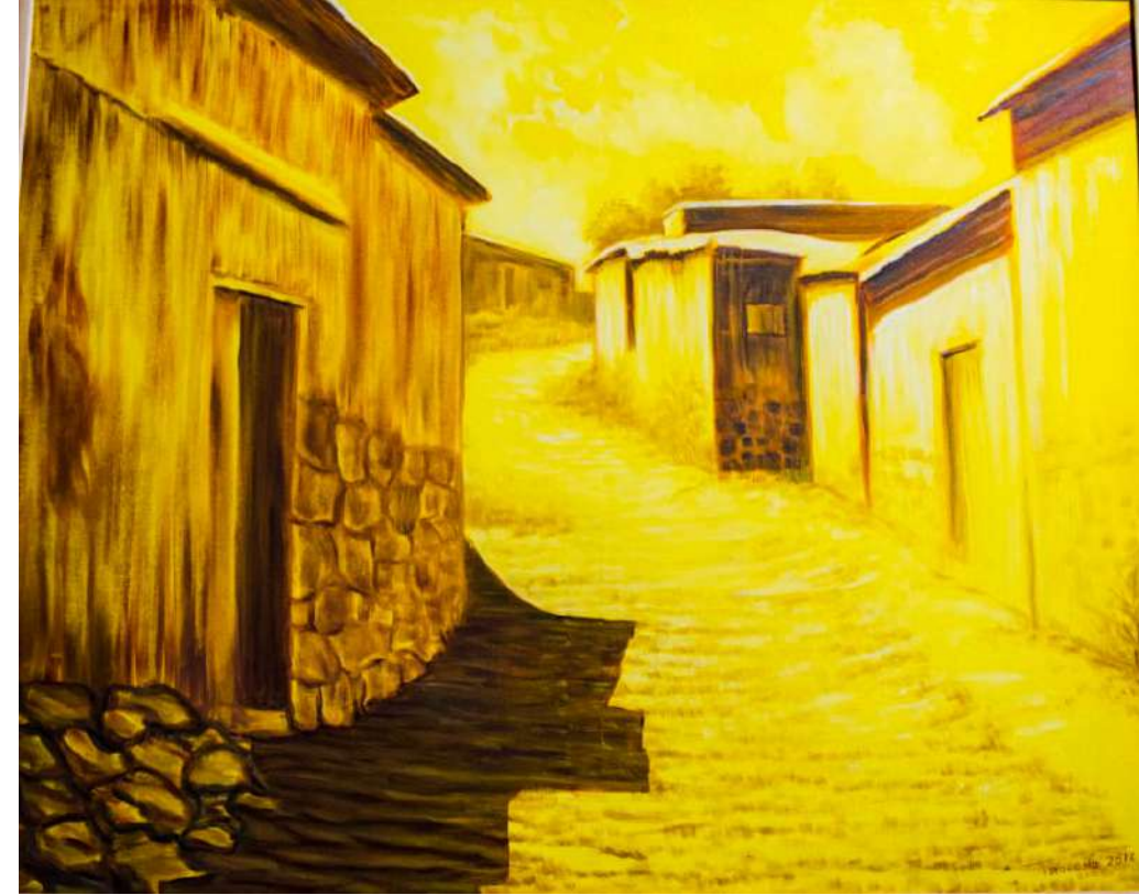
Title: Calle de Tilcara Medium: Oleo/Oil