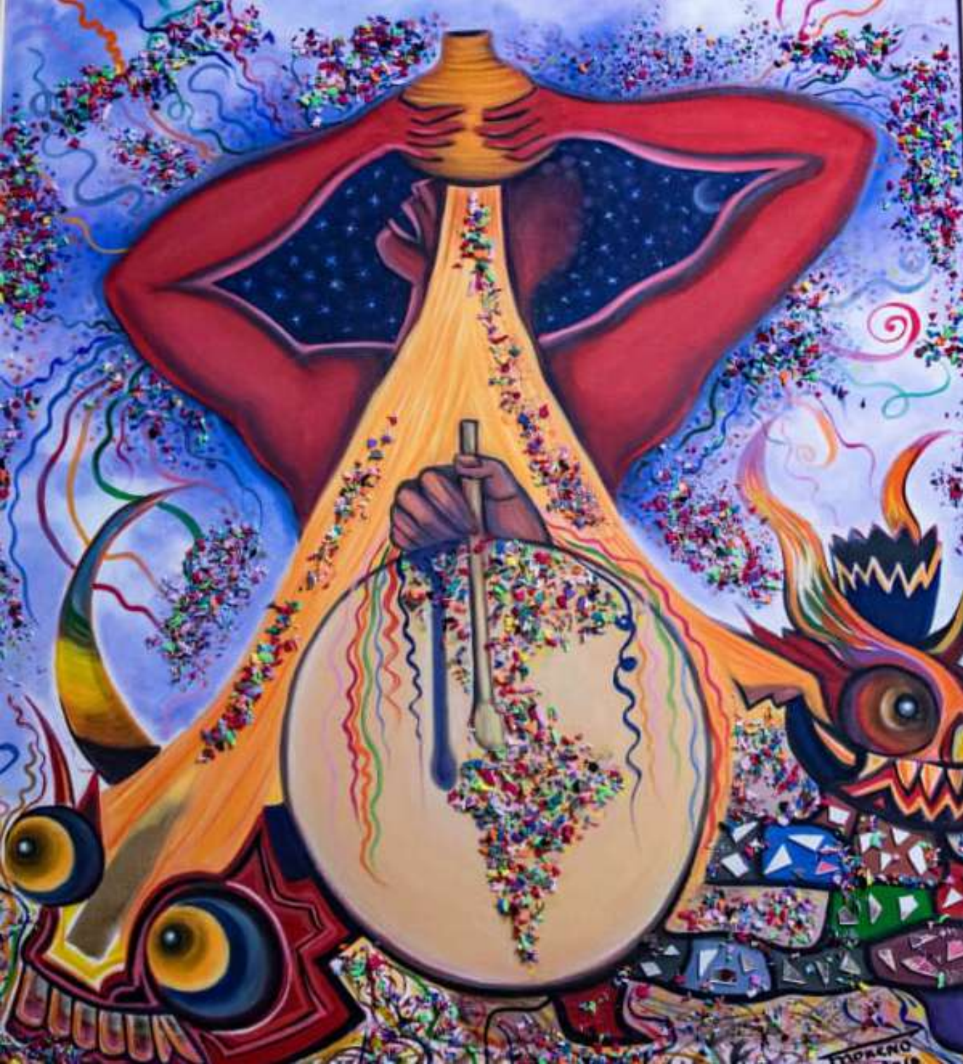
Title: Carnaval Medium: Oleo/Oil