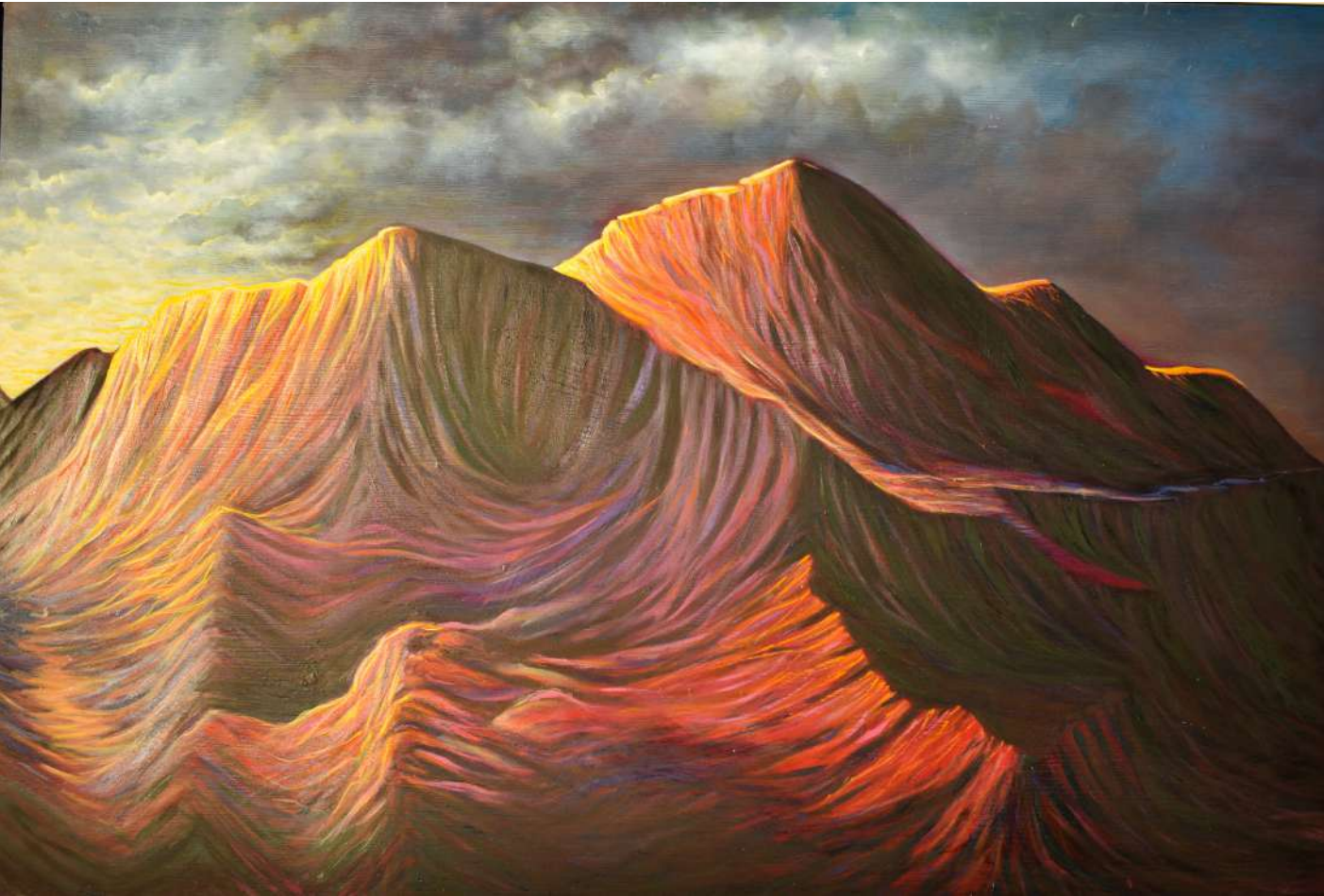
Title: Sol Andino Medium: Oleo/Oil