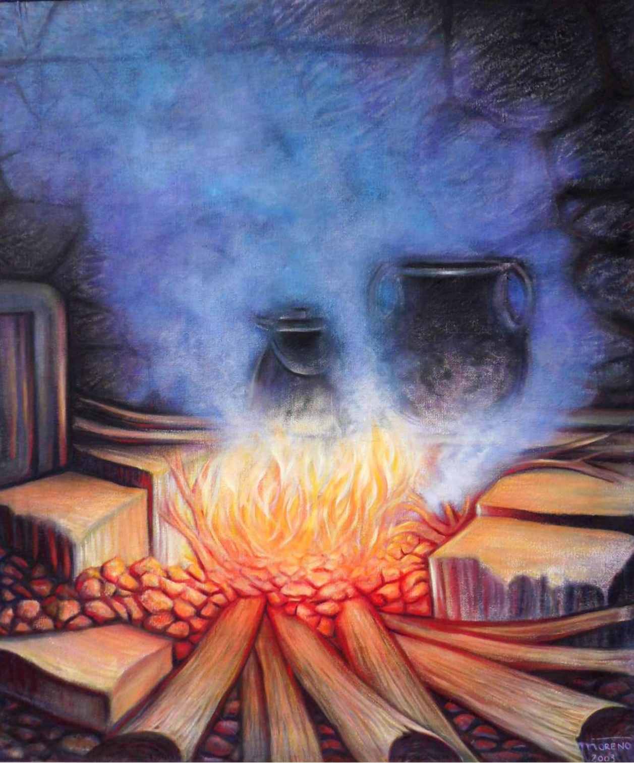
Title: Cocina del Pucará Medium: Oleo/Oil