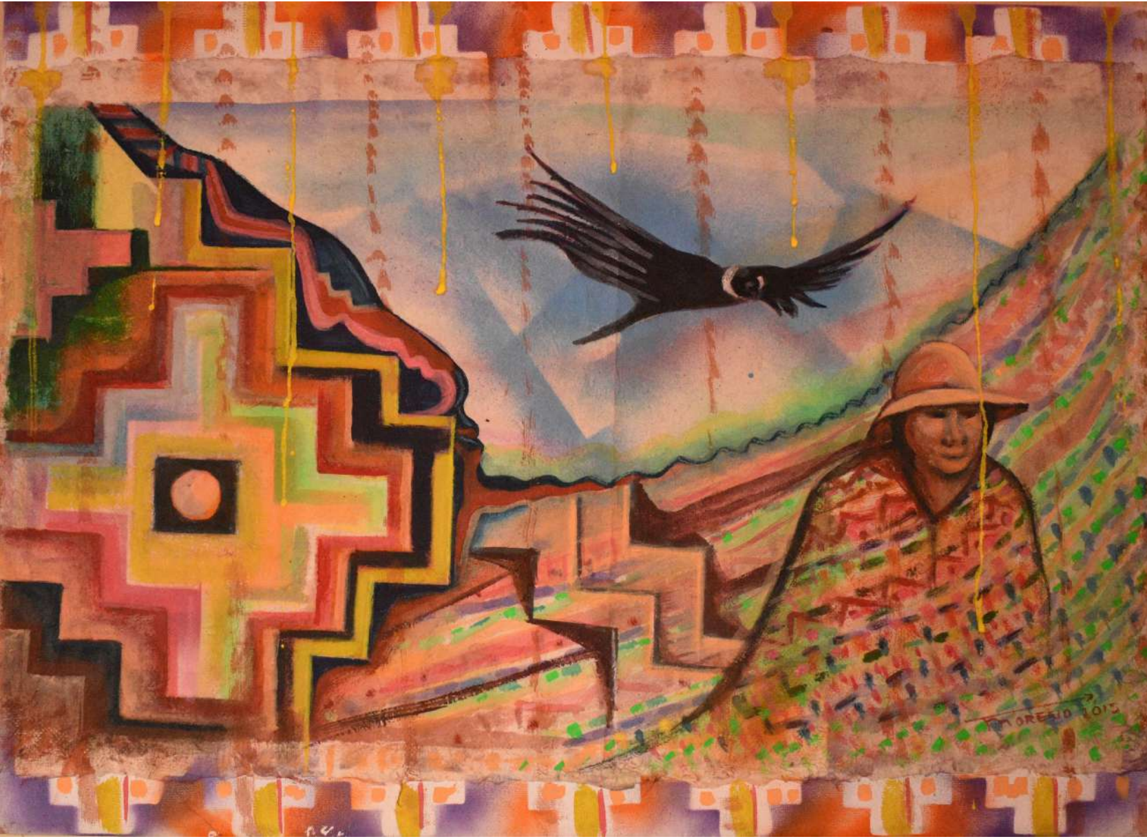
Title: Condor Medium: Acrilico/ Acrylic