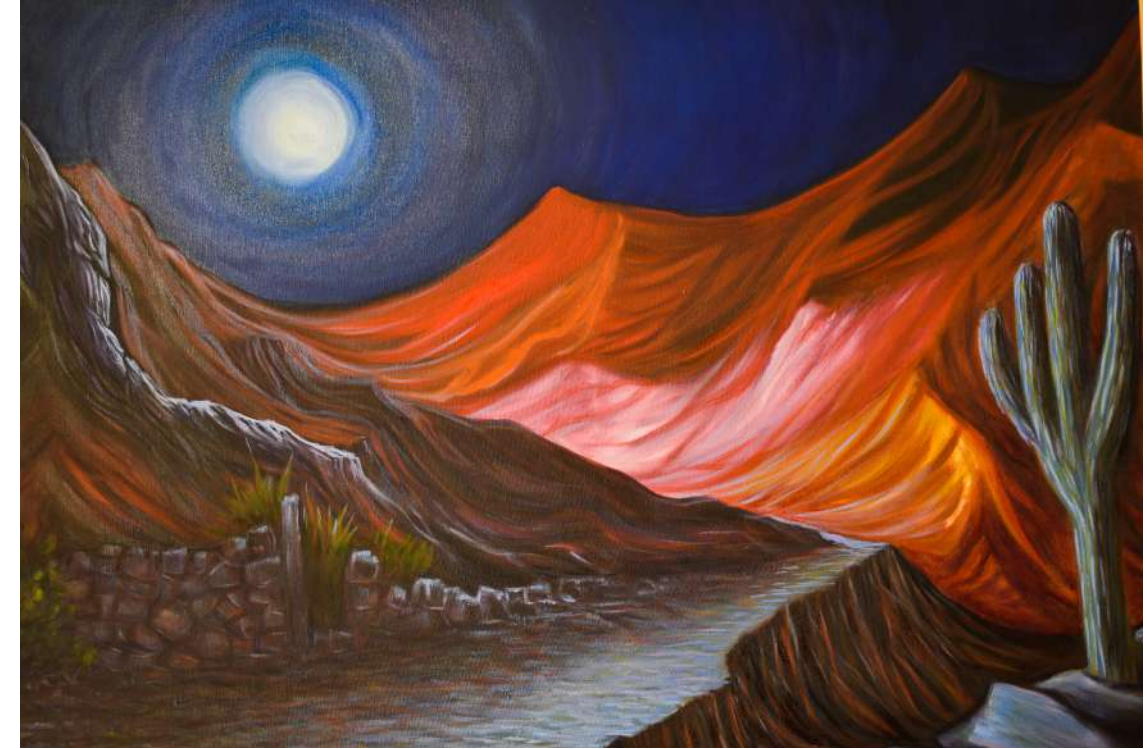
Title: Nocturno Quebradeño Medium: Oleo/Oil